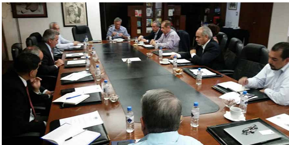
Reunión del Comité de Libros de Interés General.