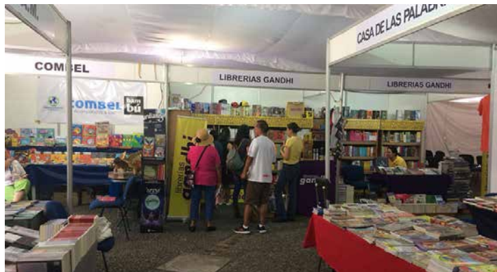
Con gran presencia editorial se celebra esta fiesta del libro.