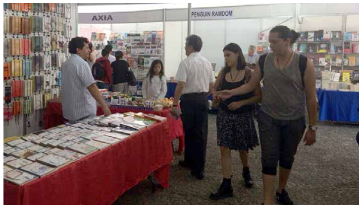
La feria busca colocarse en el centro de la agenda cultural.